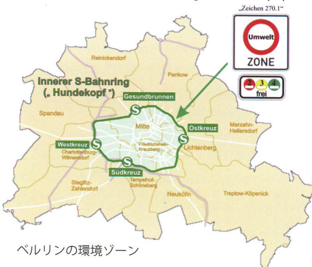
ベルリンの環境ゾーン

http://www.bmu.de/luftreinhaltung/doc/40590.php