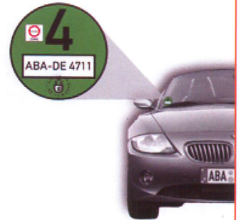
フロントガラスの右下に貼る